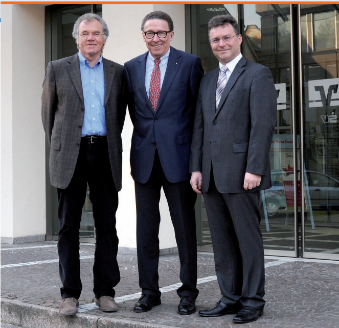
RNZ, Bürgerstiftung und Landrat machen es möglich: Für herausragendes bürgerschaftliches Engagement gibt es seit 2007 den Ehrenamtspreis, mit dessen viel beachteter Verleihung jegliche ehrenamtliche Tätigkeit eine besondere Würdigung erfährt.

Der von Bürgerstiftung und Rhein-Neckar-Zeitung vergebene Ehrenamtspreis der Region Mosbach soll das Interesse für das bürgerschaftliche Engagement nachhaltig stärken und die Bedeutung des ehrenamtlichen Einsatzes öffentlich hervorheben.